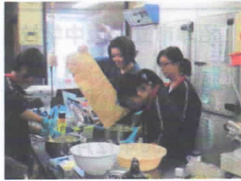
2年 職場体験（愛鷹地区を中心に 57 事業所）