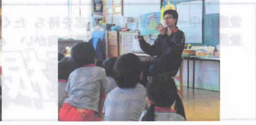
3年 保育体験（愛鷹幼稚園）

保護者、コミュニティ関係者の皆様には、学校教育に関するアンケートに協力いただきましてありがとうございました。アンケート結果と登下校や挨拶の様子、学校行事、今年から始めた小中一貫教育、夏休み中の家庭訪問、三者面談等に関するご意見や要望を今年の教育活動を振り返る際の参考にさせていただき、3学期や来年度の学校経営を充実していきたいと思っております。今年から始まった愛鷹小中一貫教育を機会に、これまでに増して、子どもの成長を家庭、地域と連携して導くことを推進して参りますので、今後もよろしくお願いいたします。