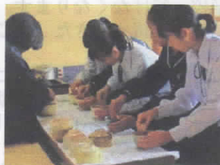
1年 先輩から技を学ぶ会・10講座(愛老連)