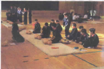
1年 救急救命講習 (駿東伊豆消防本部 救急ワークステーション)

また、12月の地域防災訓練では85%の生徒参加があり、貴重な体験をさせていただきました。消火器、シーツを用いた初期消火、マンホールのふた外しから始まる放水訓練、三角巾を用いた救急法、避難経路の確認と各自治会で工夫を凝らした訓練は生徒に鮮明な記憶となっています。