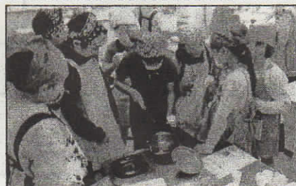
&lt;4年2組 理科 沸騰する水の変化を調べる子どもたち&gt;

実験・実習・制作などの授業では、ときに危険を伴うこともあります。大事なことは2つ。先生の指示をよく聞くことと、ふざけないで仲間と協力することです。