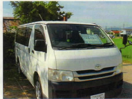
作業車両の表示 (写真はイメージです)