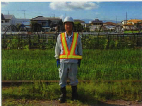
測量作業時の 作業員の服装 (写真はイメージです)